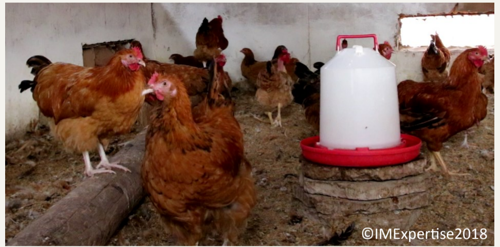
Figure 1 : Poulet du pays dans une exploitation familiale à Louga, Sénégal