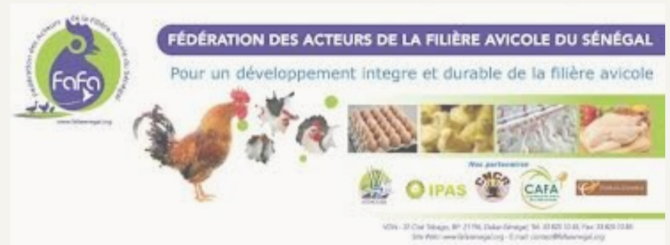
Figure 1 : Banderole de la Fédération des Acteurs de la Filière Avicole

Depuis, 1960, les gouvernements s'intéressent à l'enjeu de la modernisation de l'élevage. Plusieurs programmes ont ainsi vu le jour comme le Programme d'Ajustement du Secteur Agricole (PASA) en 1994, la loi Agro-Sylvo-Pastorale en 2004 ou le Plan Sénégal Emergent (PSE) en 2012. Ces programmes visent à accélérer la croissance et à dynamiser l'emploi.