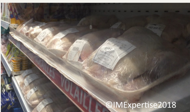
Figure 3 : Rayon volaille de la grande distribution (26/06/18)