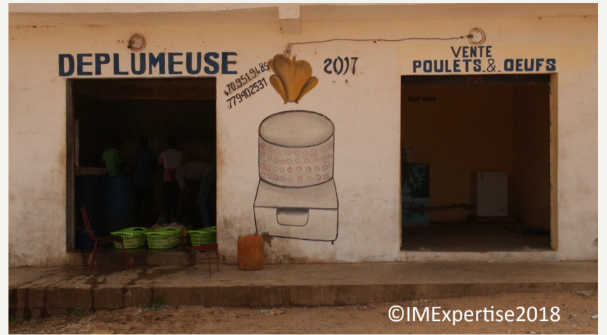
Figure 1 : Déplumeuse de Nguékhokh, Dakar, Sénégal (29/06/18)